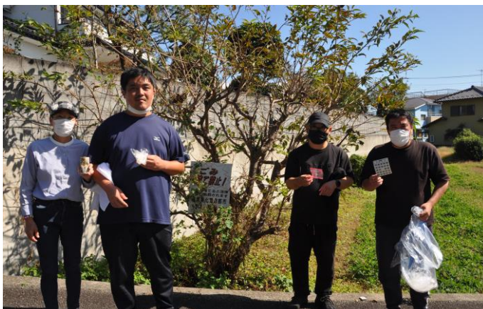
▲毎日、ゴミ拾いを行うメンバーのみなさん