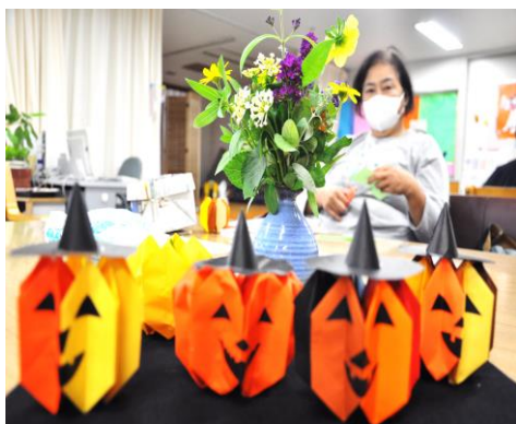
▲ いつも笑い声が弾む、楽しい「折り紙教室」