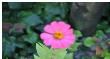
▲レジ袋のゴミを取り除くと、美しい花が...