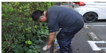
▲あれっ? こんなところに空き缶が??