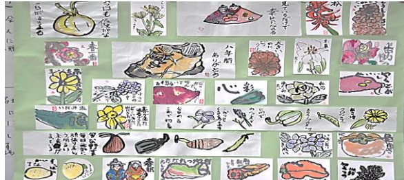
▲ のびのびと四季を描く「絵手紙教室」